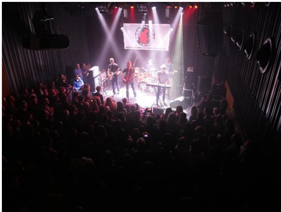
Impressie Band Talent Leiden Festival - 2015